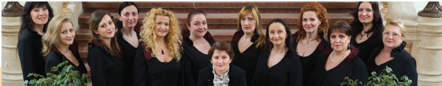
Szolnoki Bartók Béla Kamarakórus nőikara

Jegyár: 1500 Ft, Családi jegyár (szülők és gyermekeik): 2900 Ft